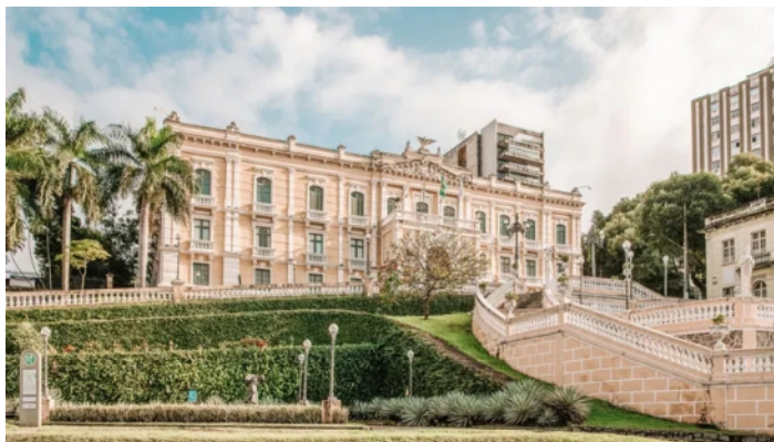
Palácio Anchieta, Centro Histórico - ES

Após o CAFÉ DA MANHÃ, faremos um tour pela simpática e histórica Vitória e, na sequência, pela linda e cativante Vila Velha. O passeio contempla um tour panorâmico pelas principais vias das praias de Vitória: Praia de Camburi, Praia do Canto, Curva da Jurema; além do Centro Histórico. Atravessando a Terceira Ponte, chegaremos a Vila Velha, 3ª capital mais antiga do Brasil. Visitaremos o famoso Convento da Penha, construído no alto de um rochedo, que encanta pela vista do mar e das duas cidades; as praias de Vila Velha com a Praia da Costa e Sereia serão vistas. Havendo possibilidade, iremos a loja da Fábrica de Chocolate Garoto. ALMOÇO incluso.