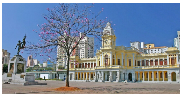
Estação Ferroviária de Belo Horizonte - MG

Neste dia, vamos acordar bem cedo e sair direto à estação para embarque no Trem de passageiros da Cia da Vale do Rio Doce. O trem nos levará para um belíssimo passeio pelos caminhos que os Bandeirantes fizeram centenas de anos atrás. O destino deste trem é Vitória, mas o nosso passeio será pelo conhecido Vale do Aço, passando por cidades como: João Monlevade, onde está a Siderúrgica Belgo Mineira, Coronel Fabriciano e finalizando em Ipatinga, onde está a sede da Usiminas. (aproximadamente 4 horas de viagem). ALMOÇO incluso em Ipatinga. À tarde, iremos rumo a Alto Caparaó, hospedagem no Caparaó Parque Hotel. JANTAR incluso.