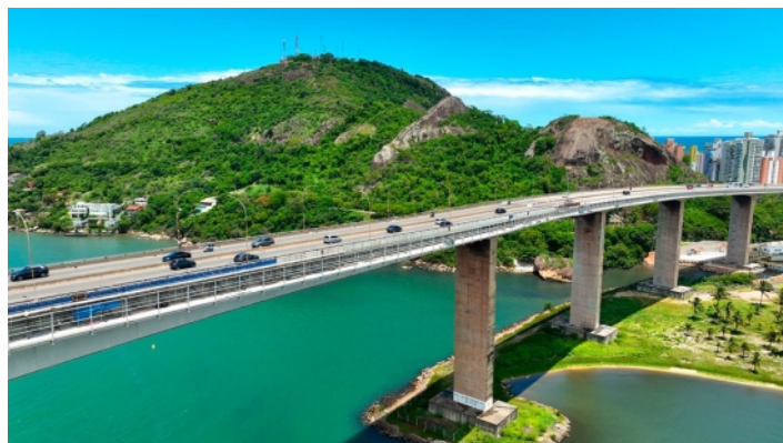
Terceira Ponte - ES