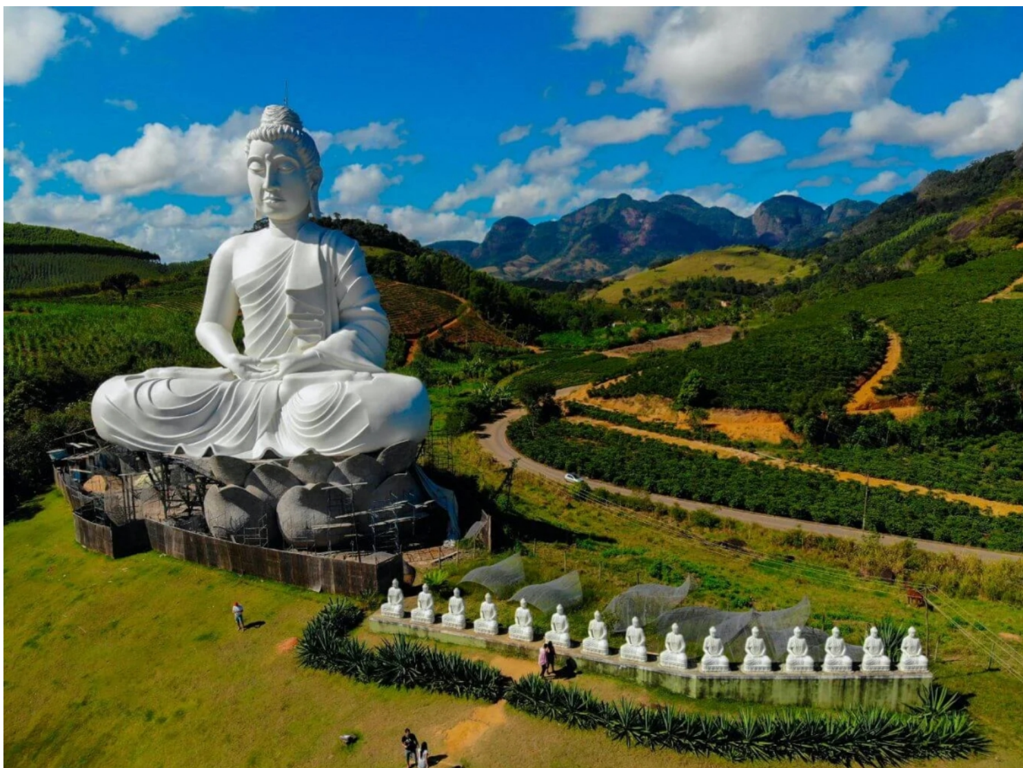
Estátua do Grande Buda de Ibirapu, Praça Torii Ibirapu - ES

Neste dia, após o CAFÉ DA MANHÃ, visitaremos a Praça do Portal do Budista e sua gigantesca estátua de Buda, localizada na entrada do Mosteiro Zen Morro da Vargem, às margens da BR-101 em Ibirapu, apenas 66 km de Vitória. A Praça Torii do Mosteiro Zen Morro da Vargem é uma área voltada totalmente ao uso da comunidade e ao interesse público. Na praça, foi construído um Jardim Zen, composto de areia, pedriscos e pedras. É um jardim contemplativo e o maior dessa modalidade em todo o Ocidente. Na parte mais alta da praça, encontram-se 15 estátuas de Budas sentados em meditação. A atração principal é a estátua de Buda com seus 35 metros de altura. Para ter ideia da altura, a estátua é maior que o Cristo Redentor, que tem 30 metros de altura. É a maior estátua de Buda do Ocidente e a 2ª maior do mundo, perdendo apenas para a estátua de Hong Kong. À tarde, visitaremos a pequenina e charmosa Santa Teresa, a capital estadual da imigração italiana e reconhecida pelo governo federal como a pioneira na imigração italiana no Brasil. Visitaremos o seu Centro Histórico, com suas áreas com espaços culturais e inúmeros remanescentes arquitetônico. Ao caminhar pelas suas ruas da cidade, será possível conferir casarios que representam a singeleza das técnicas construtivas do período da colonização italiana. Retorno a Vitória. Restante do tempo livre.