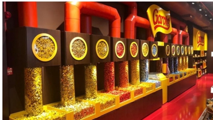
Loja da Fábrica de chocolate Garoto - ES