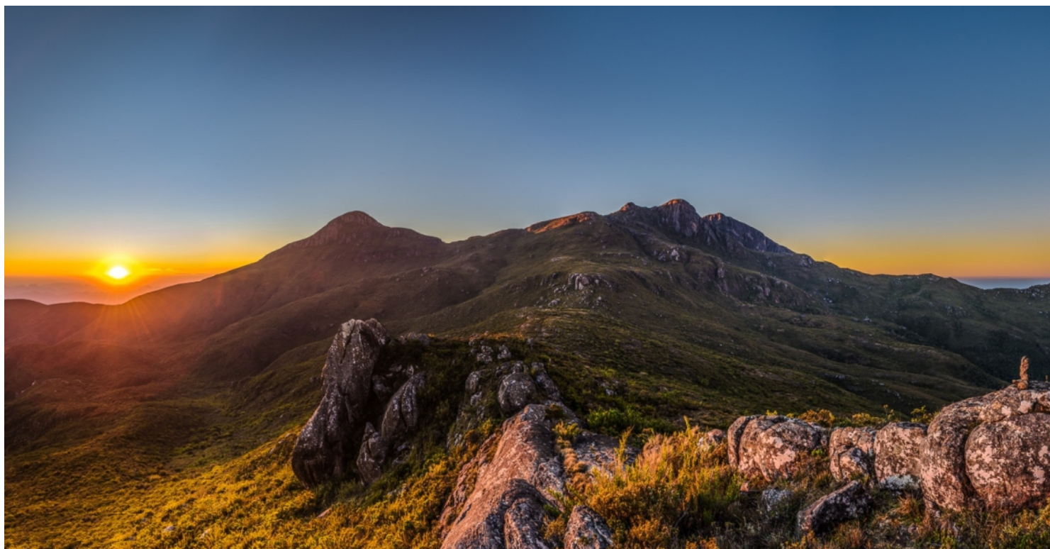
Parque Nacional do Caparaó, Alto Caparaó - MG

Após o CAFÉ DA MANHÃ, visita ao Parque Nacional do Caparaó, em caminhonete (tipo 4x4). Conheceremos alguns dos atrativos do Parque Nacional do Pico da Bandeira, tais como: Mirante da Tronqueira, Vale Verde, Cachoeira Bonita e Vale Encantado. Retorno ao hotel para ALMOÇO incluso. Na parte da tarde, visita ao Poço do Egito, com seus poços e cachoeiras de águas transparentes nos pés do Caparaó. No mesmo tipo de transporte que fizemos pela manhã (tipo 4x4). À noite, JANTAR incluso.