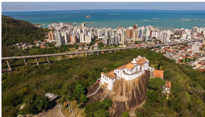
Vila Velha - ES