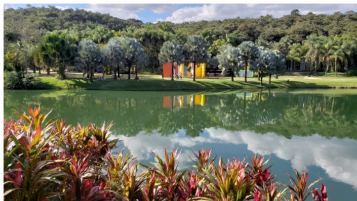
Inhotim - MG

3º dia, 08 de julho de 2024, segunda-feira, VIAGEM NO TREM DA VALE COM DESTINO A IPATINGA / ALTOCAPARAÓ (PARQUE NACIONAL DO PICO DA BANDEIRA).