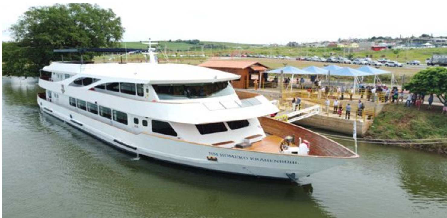
Navio NM Homero Krähenbühl

Estado de São Paulo conta com 364 municípios recheados de cultura, lazer e diversão para todos os visitantes. É possível encontrar diversas opções de roteiro, seja para quem gosta de passeios radicais e de passeios mais calmos, ao lado da natureza. Conheceremos algumas cidades no interior de São Paulo onde você poderá aproveitar as belezas naturais, a variedade gastronômica, as boas compras, as atividades culturais e artísticas, e, o melhor, longe da poluição e do frenesi. Neste programa, conheceremos: Jaú, conhecida como a capital do calçado feminino, Ibitinga, a cidade dos enxovais e a Capital Nacional dos Bordados, Barra Bonita, uma cidade praticamente debruçada sobre o rio Tietê, é o maior centro de lazer para os habitantes da cidade e turismo que atrai pessoas para o passeio pela eclusa, num cruzeiro fluvial com ALMOÇO à bordo do moderno e confortável navio “homero krähenbuhl” e Águas de São Pedro, uma das cidades turísticas do interior de SP mais graciosa e que nos convida a vivenciar a fundo o clima do interior de São Paulo.