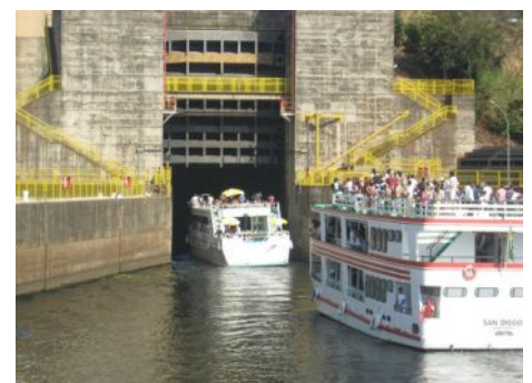
Eclusas do Tietê - Barra Bonita