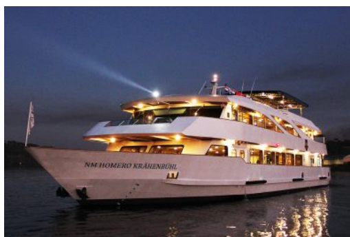
Navio NM Homero Krähenbühl