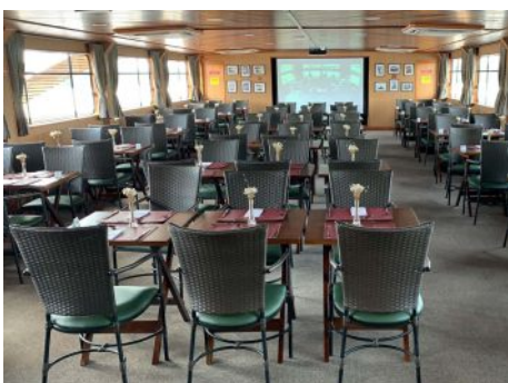
Navio NM Homero Krähenbühl

Importante: Caso haja algum impedimento por força maior na operação de eclusa do Rio Tietê, o passeio será realizado sem essa operação e podendo ser alterado o itinerário.