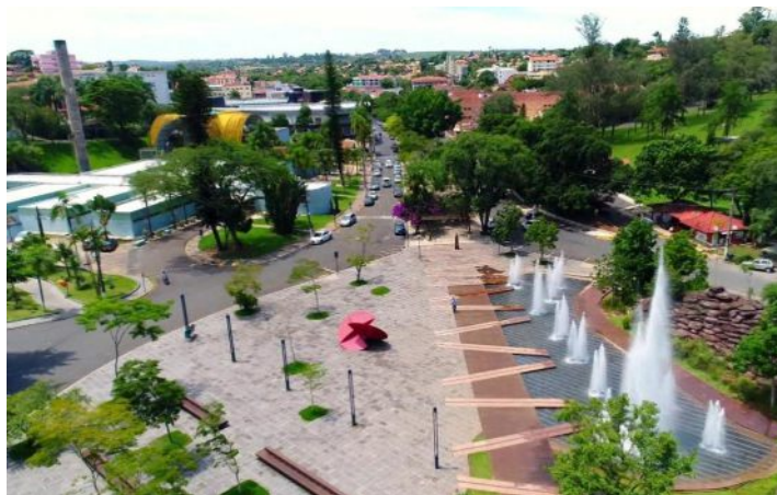
Águas de São Pedro