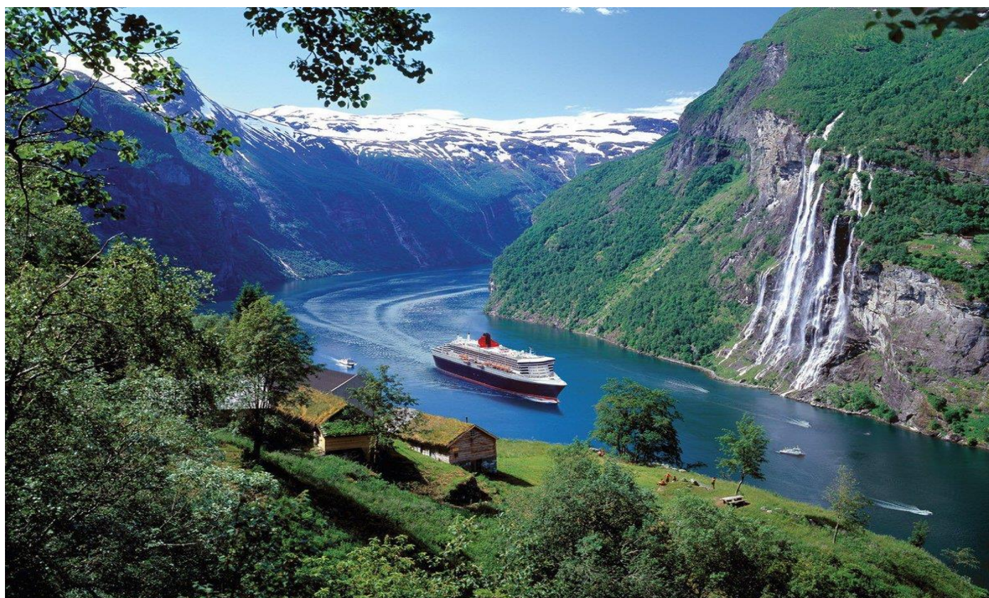
Sognefjord (Fiordes dos Sonhos), conhecido como o Rei dos Fiordes – Noruega