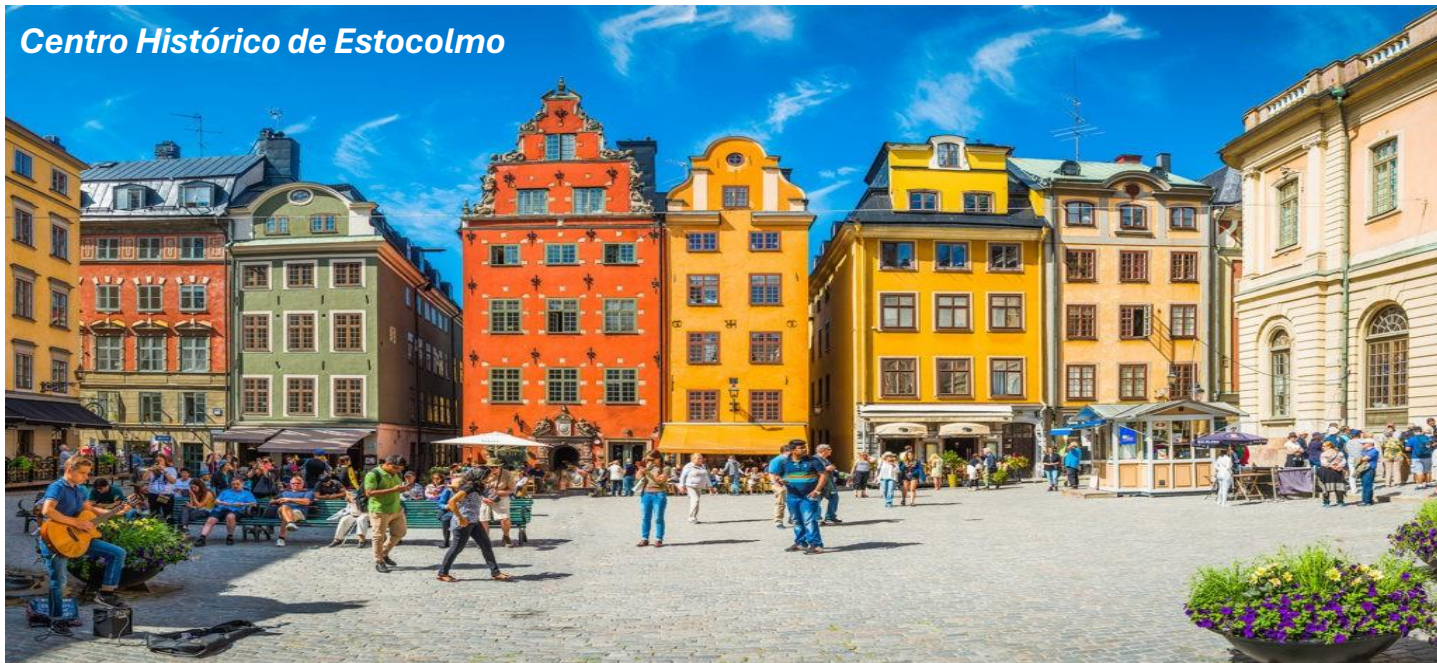
Centro Histórico de Estocolmo

CAFÉ DA MANHÃ. Na parte da manhã visita panorâmica guiada a Estocolmo. A cidade é uma das mais bonitas da Escandinávia, graças à sua geografia e seus imponentes monumentos carregados de história. Visitaremos a parte antiga da cidade que é chamada de Gamla Stan, localizada em uma pequena ilha que abriga essa cidade medieval com suas pequenas praças, ruelas e edifícios coloridos. Contemplaremos o exterior do Palácio Real, em estilo barroco, construído no século XVIII, hoje é residência oficial da família Real na Suécia. A Catedral Católica de Estocolmo “São Nicolau”, o prédio do Parlamento, conhecido como Risksdag que consiste com dois prédios subterrâneo conectados e o Parque Kungstradgarden, o mais famoso da cidade em pleno coração, repleto de cafés e restaurantes. Devido a sua proximidade com o Palácio Real, funcionou por muitos anos como o Jardim do Rei. Restante do tempo livre.