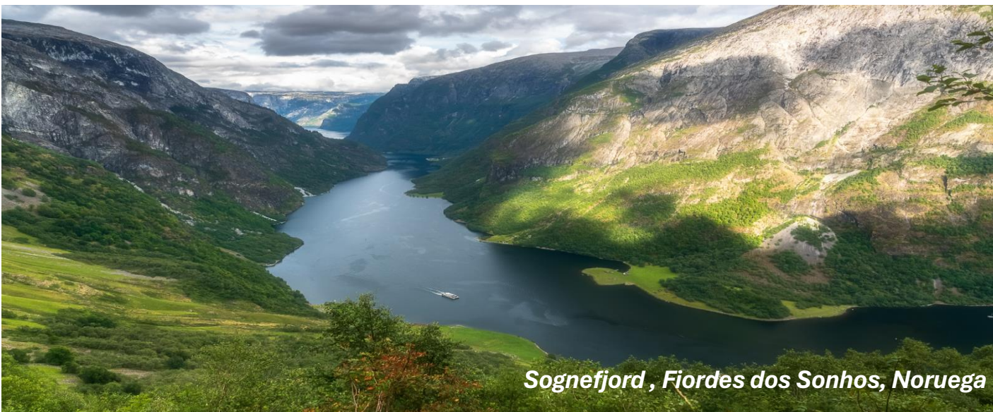
Sognefjord , Fiordes dos Sonhos, Noruega

Após o CAFÉ DA MANHÃ , tour panorâmico guiado pela Capital da Noruega, incluindo: o importante Parque Frogner com mais de 200 esculturas em bronze do escultor norueguês Gustav Vigeland, que desenhou a medalha do Prêmio Nobel da Paz, o Prédio da Prefeitura, o mais emblemático da cidade, é o lugar que acontece anualmente a entrega do Prêmio Nobel da Paz, o Palácio Real, símbolo importante da história do país e residência oficial da família real, o Prédio Neoclássico da Universidade, o lindíssimo prédio do Parlamento, símbolo da democracia norueguesa, a Ópera de Oslo, um dos monumentos mais icônicos de Oslo e a Fortaleza Medieval de Akershus. No tempo livre, sugerimos caminhar pela movimentada rua Karls Johans Gate ou Aker Brygger, repletas de lojinhas, bares, restaurantes e entretenimento ou visitar o Museu do Barco Viking, integrado ao museu de história e cultura do país.