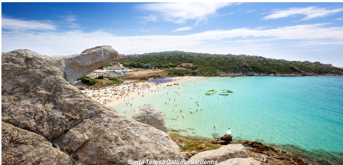
Santa Teresa Gallura, Sardenha

Chegada na parte da manhã a Sardenha, grande ilha italiana no Mar Mediterrâneo. Desembarque no Porto de Ólbia e traslado a Santa Teresa Gallura, apenas 62km. Santa Teresa Gallura, no extremo norte da Sardenha é uma pitoresca cidade com praias intocadas formadas por uma natureza única, onde o Mar do Mediterrâneo em vários tons de azul e verde transforma em um espetáculo a parte. Uma vila com paisagens naturais deslumbrantes e uma animada vida noturna. No coração da vila fica a Piazza Vittorio Emanuele I, uma animada praça central, com suas cafeterias, lojas de lembrancinhas e joalherias, é um ponto de encontro. Vamos tirar fotos da Igreja de São Victor, do século XIX e caminhar ao da Via XX Settembre, onde estão os restaurantes, bares e sorveterias todos coloridos. HOSPEDAGEM no Hotel Santa Teresa ou similar.