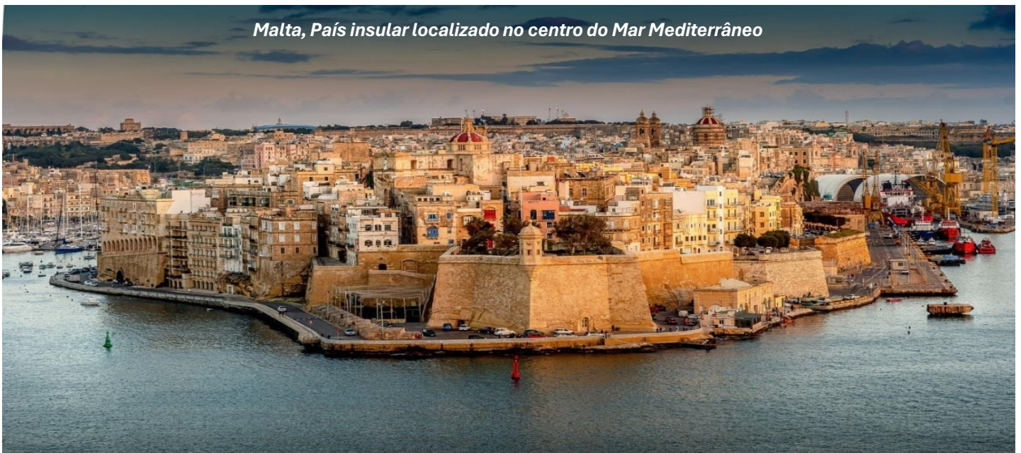
Malta, País insular localizado no centro do Mar Mediterrâneo