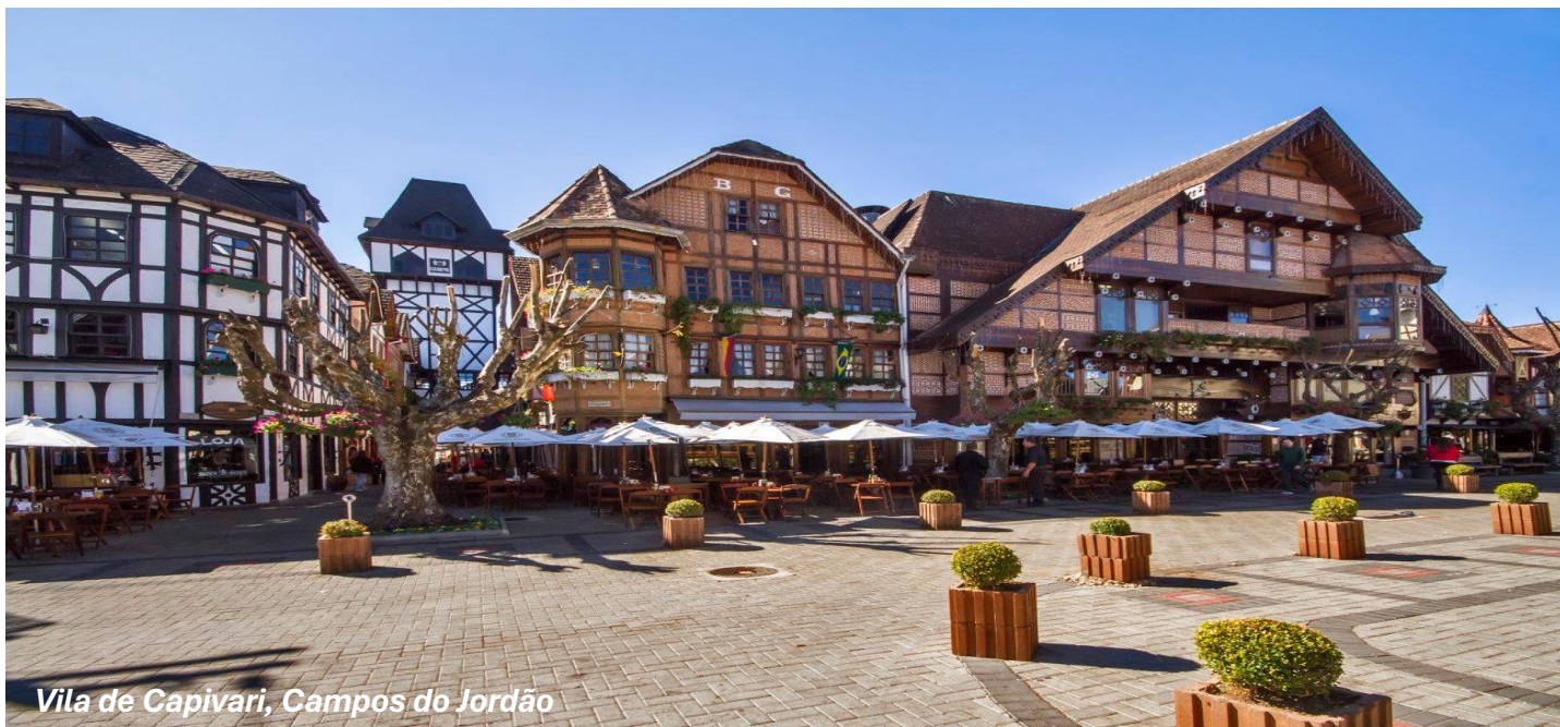
Vila de Capivari, Campos do Jordão

CAFÉ DA MANHÃ . Em horário determinado iremos a Guararema, apenas 39 km. Na chegada, em companhia de um guia local, iremos visitar a Igreja de Nossa Senhora da Escada (São Longuinho), a seguir, iremos ao Mirante Prefeito Gerbásio Marcelino com sua vista privilegiada da cidade e o famoso letreiro de Guararema que nas fotos ficam emoldurados pela maravilhosa Mata Atlântica. Prosseguindo conheceremos um pouco do centro da cidade onde não falta o que fazer: natureza, construções históricas, variada gastronomia e o aconchego de uma cidade pequena, mas com boas opções de lazer e cultura. Visitaremos o Centro de Artesanato Dona Nenê com produtos típicos de Guararema feitos com matérias da região como madeira, bambu e cerâmica, o charmoso e queridinho pelos turistas Mercado Municipal que mantém a sua arquitetura original e a Igreja Matriz de São Benedito. Nos dirigiremos a Estação Ferroviária de Guararema para embarque no Trem Turístico de Guararema no VAGÃO RESTAURANTE com várias opções de quitutes gostosos e bebidas entre eles: wellcome drink com espumante e suco de uva. Nosso percurso será até a Vila histórica de Luís Carlos e o serviço de gastronomia a bordo será na ida e na volta. Desembarque em Guararema. Retorno a Taubaté para pernoite.