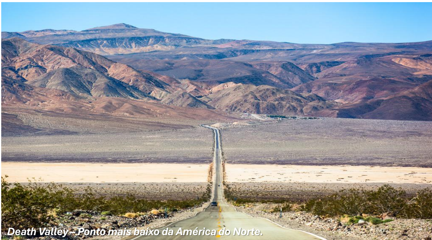
Death Valley – Ponto mais baixo da América do Norte.

Nesta dia, após CAFÉ DA MANHÃ , viajaremos ao norte por dentro da High Sierra, onde a Tioga Road, belíssima estrada que atravessa o parque, e nos levará ao coração do Yosemite National Park. Mais conhecido por suas incríveis cachoeiras, grandes prados e formações rochosas espetaculares. Yosemite foi um dos primeiros parques de vida selvagem nos EUA. Mergulhamos nas maravilhas do parque com uma caminhada pelas cachoeiras, tão espetaculares quanto as imensas paredes de granito que elas percorrem. Em seguida, deixamos as maravilhas do Yosemite para trás ao continuarmos nossa jornada com destino à bela São Francisco. Considerada uma das mais incríveis cidades do mundo por inúmeras razões, São Francisco oferece paisagens únicas e atividades que suprem todos os desejos. Chegada e HOSPEDAGEM no Hilton San Francisco Union Square ou similar.