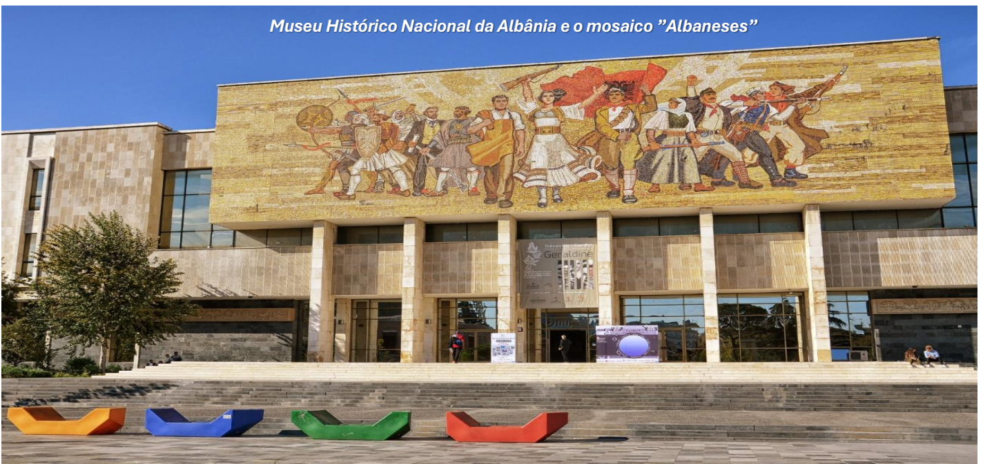
Museu Histórico Nacional da Albânia e o mosaico "Albaneses"