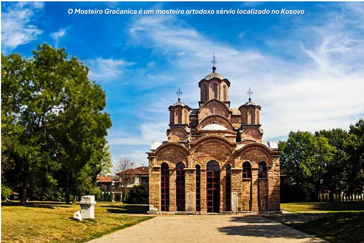
O Mosteiro Gračanica é um mosteiro ortodoxo sérvio localizado no Kosovo

CAFÉ DA MANHÃ . A seguir, faremos um tour guiado pela capital da Macedônia, uma cidade milenar e charmosa com paisagens que parecem obras de arte. Skopje está à beira do Rio Vardar, misturando modernidade e história, com uma rica tapeçaria cultural e histórica que reflete as várias civilizações que passaram pela região ao longo dos séculos. Apreciaremos a herança romana, bizantina e otomana nesta linda capital, com destaque para o monumento de Daut Pasha Hamam e sua galeria de arte; o Museu de Madre Teresa, santa católica nascida em Skopje no ano de 1910 que dedicou sua vida ao trabalho humanitário, especialmente em Calcutá, na Índia, onde fundou as Missionárias da Caridade; e para o Castelo de Kale Skopje, fortaleza histórica localizada na parte velha da cidade. Tempo livre para caminhar pelo centro histórico da cidade.