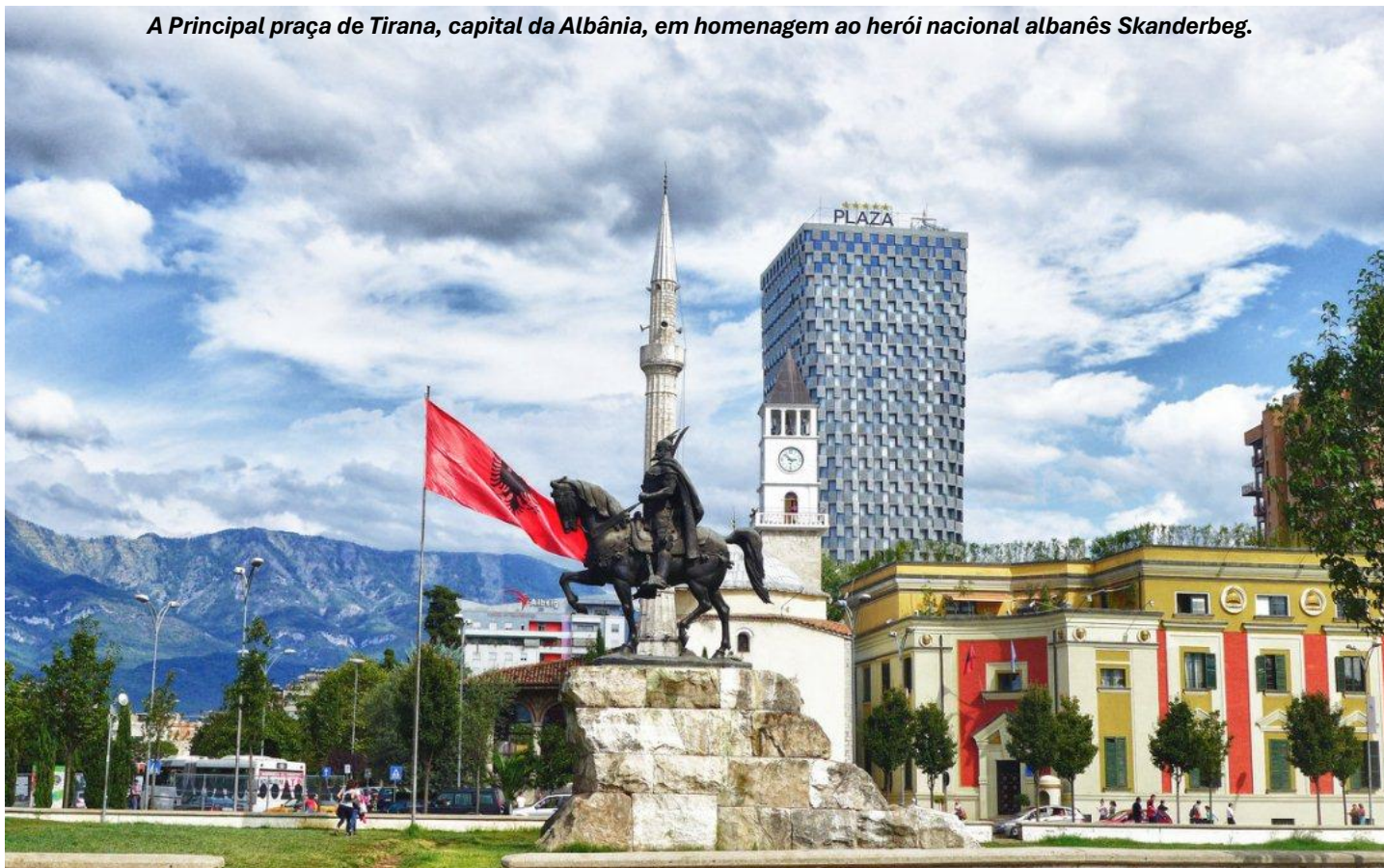
A Principal praça de Tirana, capital da Albânia, em homenagem ao herói nacional albanês Skanderbeg.

CAFÉ DA MANHÃ. Saída para um passeio pelos principais destaques turísticos de Tirana, a capital da Albânia. A cidade vibrante é cheia de contrastes e mistura história, cultura e modernidade. Começaremos pela Praça Scanderbeg, chamada assim em homenagem a Scanderbeg, herói nacional devido a seus feitos militares. Seguiremos passando por singulares estruturas como: o prédio da Prefeitura; a Estátua de Scanderbeg; a Mesquita Ethem Bey, uma das maiores e mais importantes para os muçulmanos na Albânia; a Torre do Relógio; a Biblioteca Nacional; a Ópera, que é o maior teatro do país; o famoso mural do mosaico "Albaneses" na fachada do Museu Histórico Nacional e o Dajti Ekspres, maior sistema de bondes cabeados da Albânia. Restante do tempo livre para aproveitar a cidade.