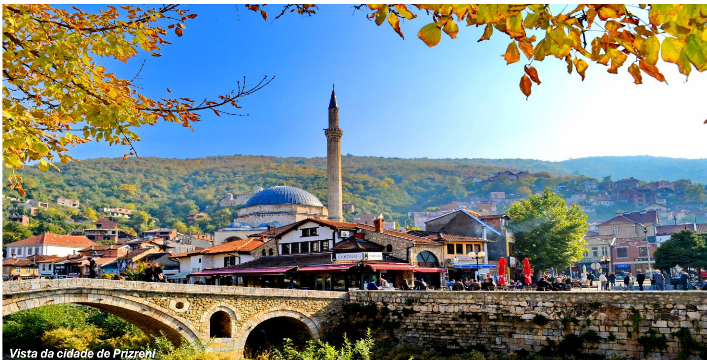
Vista da cidade de Prizren

Após o CAFÉ DA MANHÃ , saída para a cidade de Prizren, a menos de 90km de Pristina. A charmosa cidade é o berço da rica cultura do povo kosovar. Faremos um passeio pelo belíssimo centro histórico que nos levará à Ponte Otomana e às diversas igrejas e mesquitas existentes na cidade, com destaque para a Mesquita do Pasha Sinan, construída em 1615, em pleno centro histórico. Devido a sua localização privilegiada, dimensões dos seus minaretes, que são torres construídas em estilo otomano, de sua cúpula e seu reconhecido estilo, a Mesquita Sinan Pasha representa os principais monumentos da cidade. Prizren é uma cidade multicultural com 3 línguas oficiais que ilustram o passar dos séculos do povo sérvio, albanês e turco. Na cidade ainda podemos encontrar a Igreja Ortodoxa de Nossa Senhora de Ljevis, inscrita na lista de Patrimônio Mundial da Unesco. Ao final do dia, retorno ao hotel.