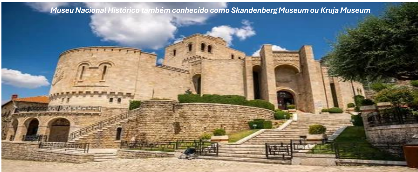
Museu Nacional Histórico também conhecido como Skandenberg Museum ou Kruja Museum

CAFÉ DA MANHÃ. Visita guiada por Ohrid com o seu lago mais profundo dos Balcãs que recebeu o título de Patrimônio Mundial Natural pela UNESCO. A cidade é famosa pela autenticidade das suas casas e importância histórica que teve enquanto centro do saber e da religião ortodoxa no período Renascentista e da Alta Idade Média. As vistas para o lago são incríveis e as capelas e mosteiros construídos nas suas margens ajudam a compor um cenário idílico dos mais bonitos de toda a Península Balcânica. Podemos explorar as principais atrações da cidade, como a Igreja de Santa Sofia, monumento medieval mais eminente na Macedônia com magníficos afrescos bizantinos, e a Cidade Antiga de Ohrid. Neste dia, teremos como opcional passeio de barco pelo grandioso lago que margeia a cidade. JANTAR incluso.