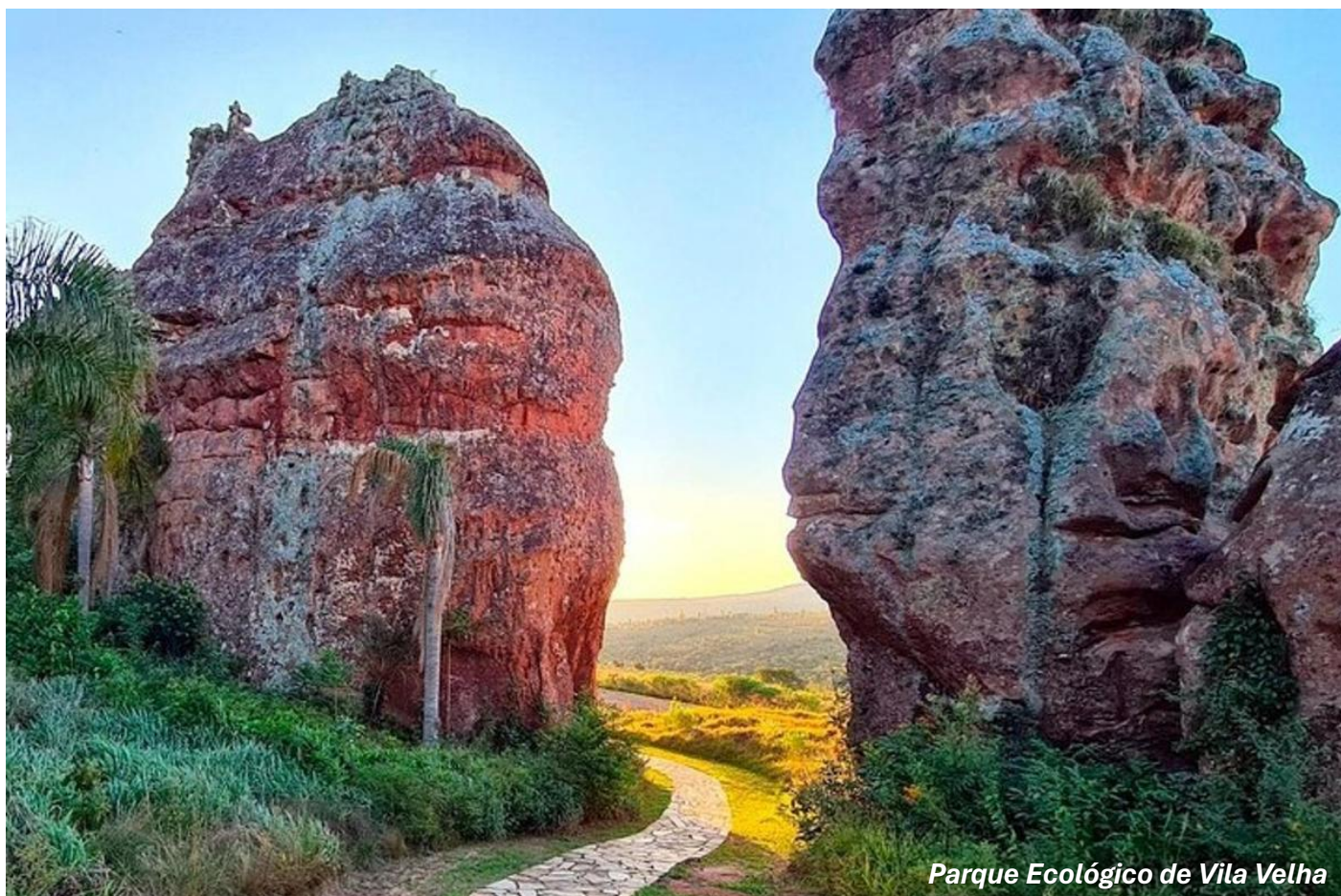
Parque Ecológico de Vila Velha