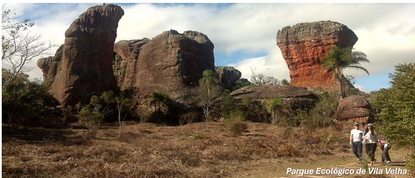
Parque Ecológico de Vila Velha