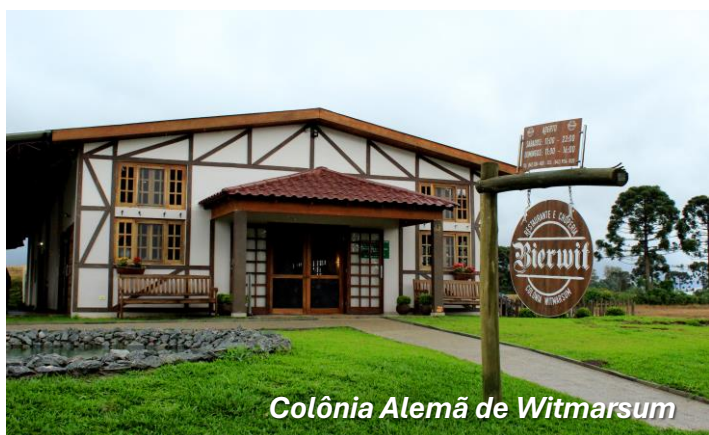
Colônia Alemã de Witmarsum

CAFÉ DA MANHÃ. Saída para visitarmos o Parque Ecológico de Vila Velha, apenas 23km. Um sítio arqueológico com o conjunto de formações rochosas que lembra uma cidade medieval com seus castelos e torres em ruínas que além de cartão postal, tem grande importância histórica e cultural para o Brasil. Reúne formações de arenito com mais de 300 milhões de anos. A seguir, iremos visitar a Colônia Alemã de Witmarsum, com aproximadamente 2 mil habitantes que faz com que a gente se sinta um pouquinho em um pequeno vilarejo da Alemanha. Isso porque a arquitetura, a gastronomia e os costumes da colônia possuem traços germânicos fortes, heranças de imigrantes que chegaram nos anos 30 e constituíram famílias na região. Retorno a Ponta Grossa e tempo livre.