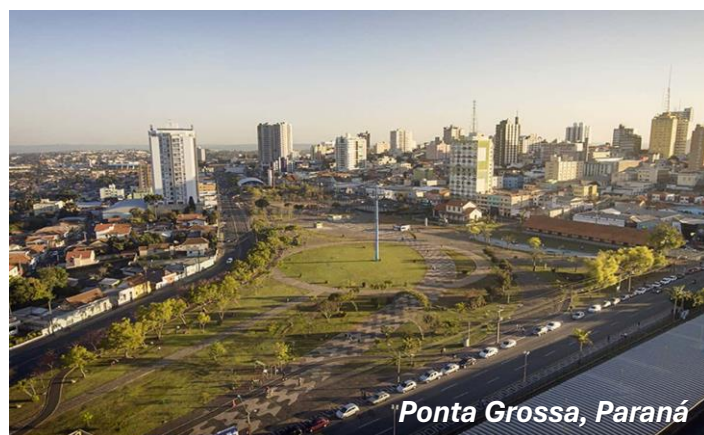
Ponta Grossa, Paraná