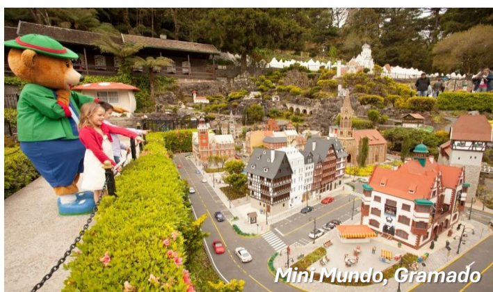
Mini Mundo, Gramado