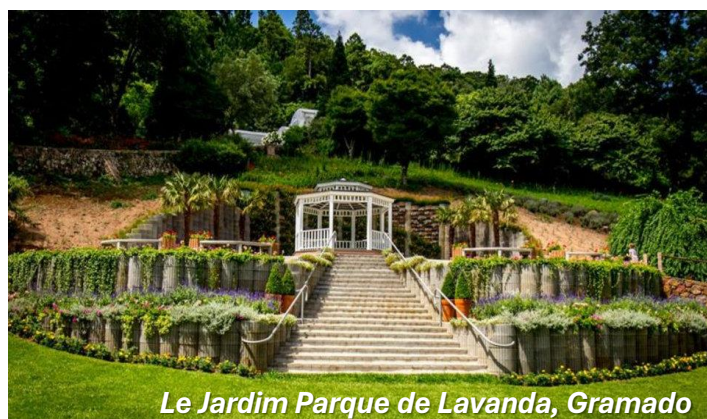
Le Jardim Parque de Lavanda, Gramado