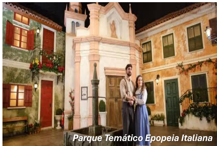
Parque Temático Epopeia Italiana