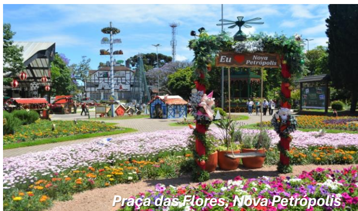
Praça das Flores, Nova Petrópolis

Após o CAFÉ DA MANHÃ , sairemos de Gramado com destino ao berço da colonização italiana no Brasil, Caxias do Sul, que mantém preservada a tradição dos imigrantes que ali chegaram no final do século XIX vindos da Lombardia e Vêneto; que trouxeram com eles a cultura do vinho que hoje torna a cidade e a região reconhecidas e com marcas premiadas internacionalmente. Mas antes, iremos à colônia alemã em Nova Petrópolis, onde as tradições são marcantes e preservadas por seus moradores. A gastronomia, arquitetura, os parques e atrativos remetem a pequenos vilarejos da Alemanha. Visitaremos a Praça da República, carinhosamente chamada de Praça das Flores e, no centro da cidade, temos como principal atrativo o imenso labirinto verde e o Armazém da Rosa Mosqueta. Chegada a Caxias do Sul e HOSPEDAGEM no Hotel Blue Tree ou similar. À noite, vamos ao Parque de Eventos da Festa Nacional da Uva, um dos maiores e mais completos espaço de eventos do Brasil. Cercado por ampla área verde, encontra-se em uma região elevada, oferecendo belíssima vista panorâmica da cidade.