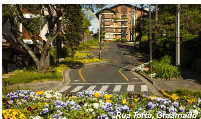
Rua Torta, Gramado