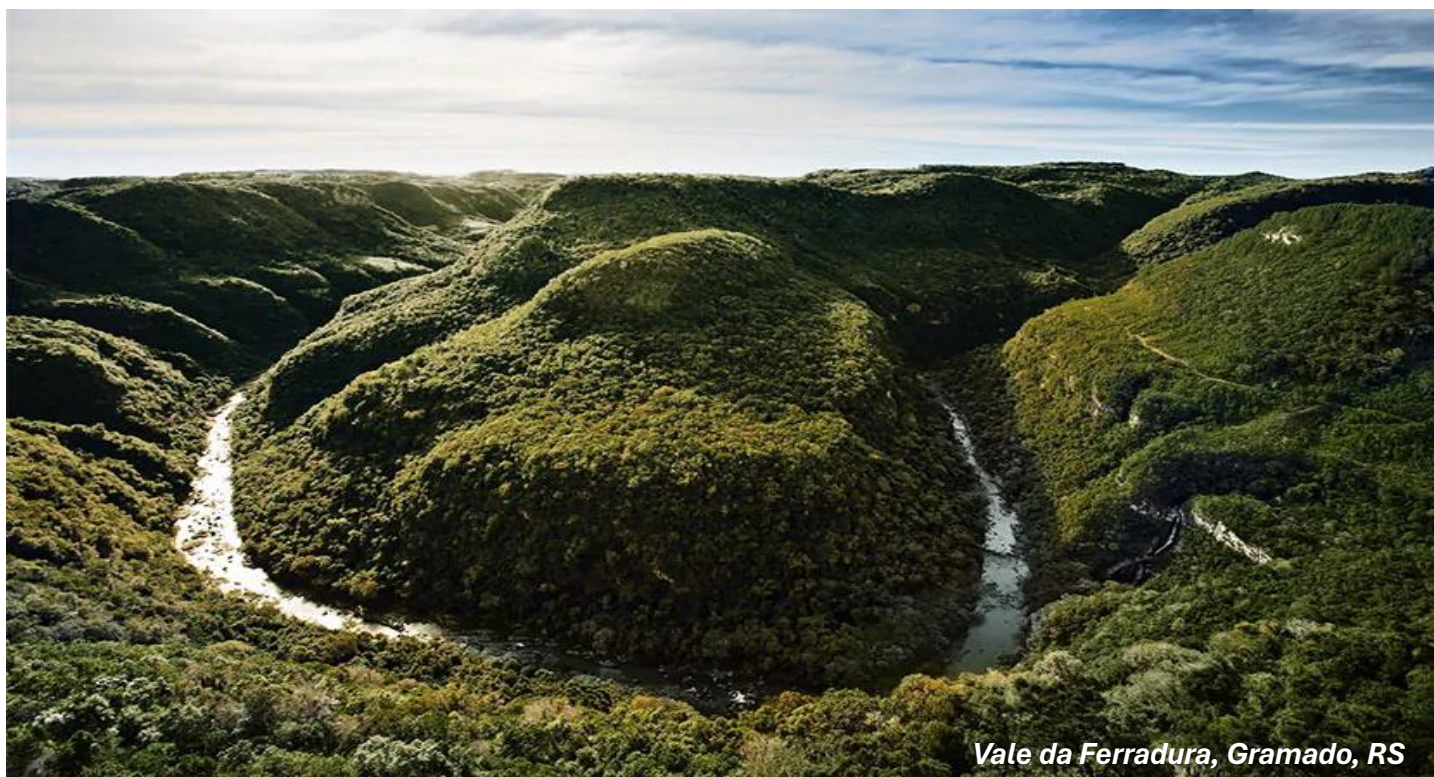
Vale da Ferradura, Gramado, RS

NOVA PETRÓPOLIS , uma cidade colonizada por imigrantes alemães, que cultivam seus costumes com muita força e representatividade; a preservação da língua alemã, as danças, as músicas folclóricas, os trajes típicos, a gastronomia e a arquitetura enxaimel perpetuam a identidade trazida pelos desbravadores desta terra. Nesse contato iremos visitar: a Praça da República, carinhosamente chamada de Praça das Flores, no centro da cidade que tem como o principal atrativo o imenso labirinto verde, e o Armazém da Rosa Mosqueta que proporciona experiência e conhecimentos sobre a rosa da vitória, espécie silvestre de cinco pétalas originária das regiões montanhosas da Europa Central, símbolo dos senhores feudais da Boêmia. Teremos nesta visita a oportunidade de comprar produtos que contêm a flor.