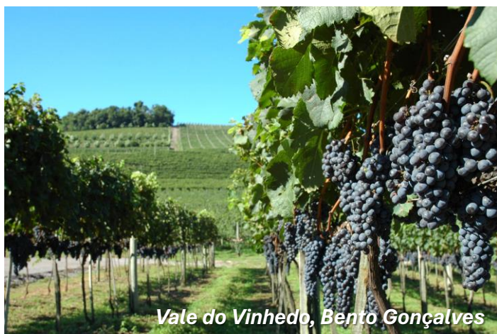
Vale do Vinhedo, Bento Gonçalves

CAFÉ DA MANHÃ. A seguir, iremos a Carlos Barbosa, 68km, onde visitaremos o show Room da Tramontina e, depois, embarcaremos no famoso Trem do Vinho, Maria Fumaça que corta a cidade de Garibaldi até Bento Gonçalves, com muita alegria e degustação durante o trajeto. Na chegada, visitaremos o Parque Temático Epopeia Italiana, um espetáculo que apresenta uma imersão envolvente na trajetória dos imigrantes italianos que chegaram ao Brasil em busca de um novo começo, apresentados em 9 cenários em tamanho real rico em detalhes, sons e emoções. ALMOÇO incluso. Tour panorâmico pelo Vale do Vinhedo, a região de maior concentração de vinícolas com selos de identificação de origem do Brasil, marcado pela beleza dos vales e montanhas cobertas de parreirais. São pequenas e grandes áreas rurais dividindo espaços com vinícolas renomadas. Está na lista dos 10 melhores destinos de vinho do Mundo. Nessa oportunidade, visitaremos uma vinícola com degustação. Retorno a Caxias do Sul.