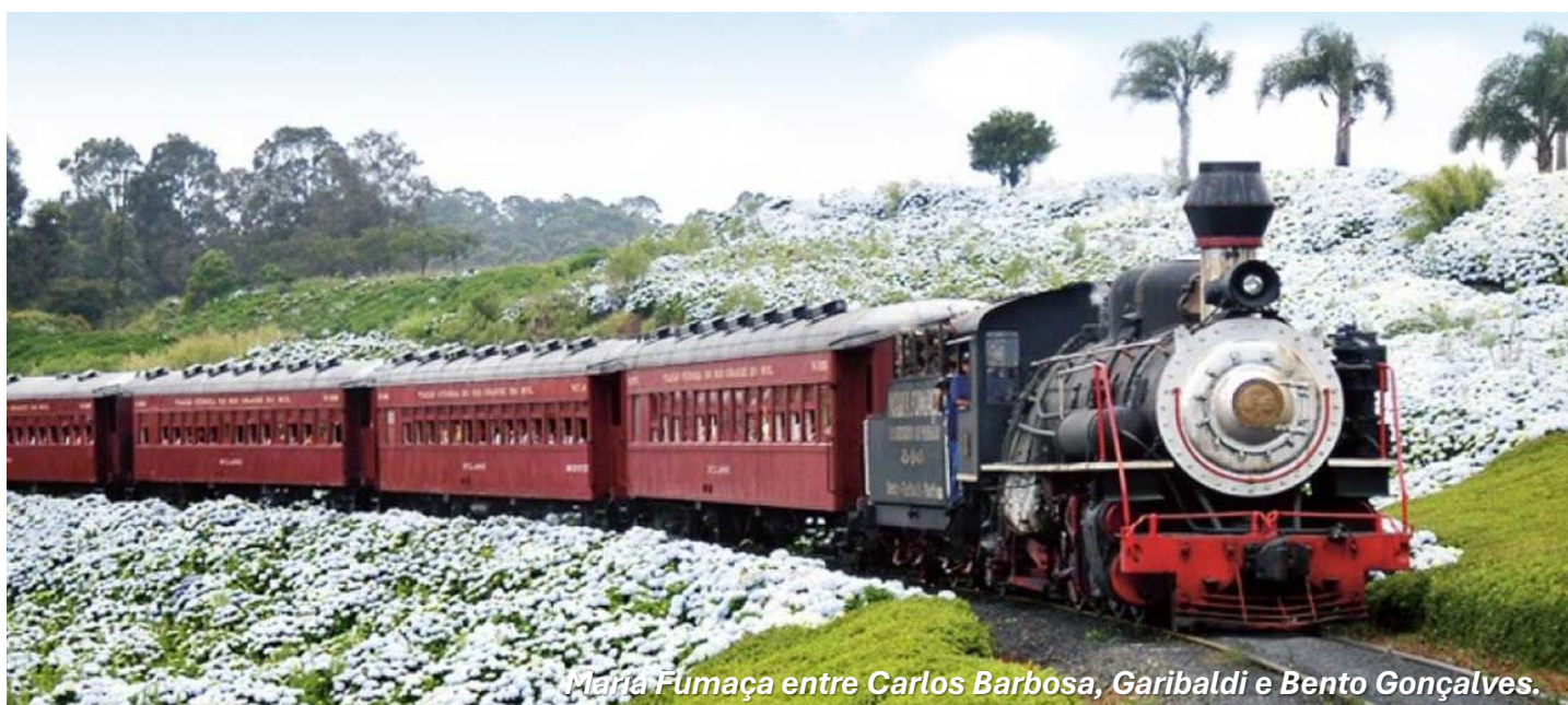
Maria Fumaça entre Carlos Barbosa, Garibaldi e Bento Gonçalves.