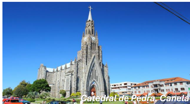
Catedral de Pedra, Canela