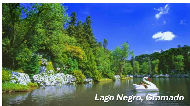
Lago Negro, Gramado