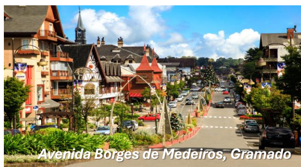
Avenida Borges de Medeiros, Gramado