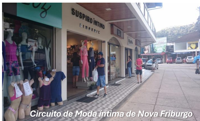
Circuito de Moda Íntima de Nova Friburgo