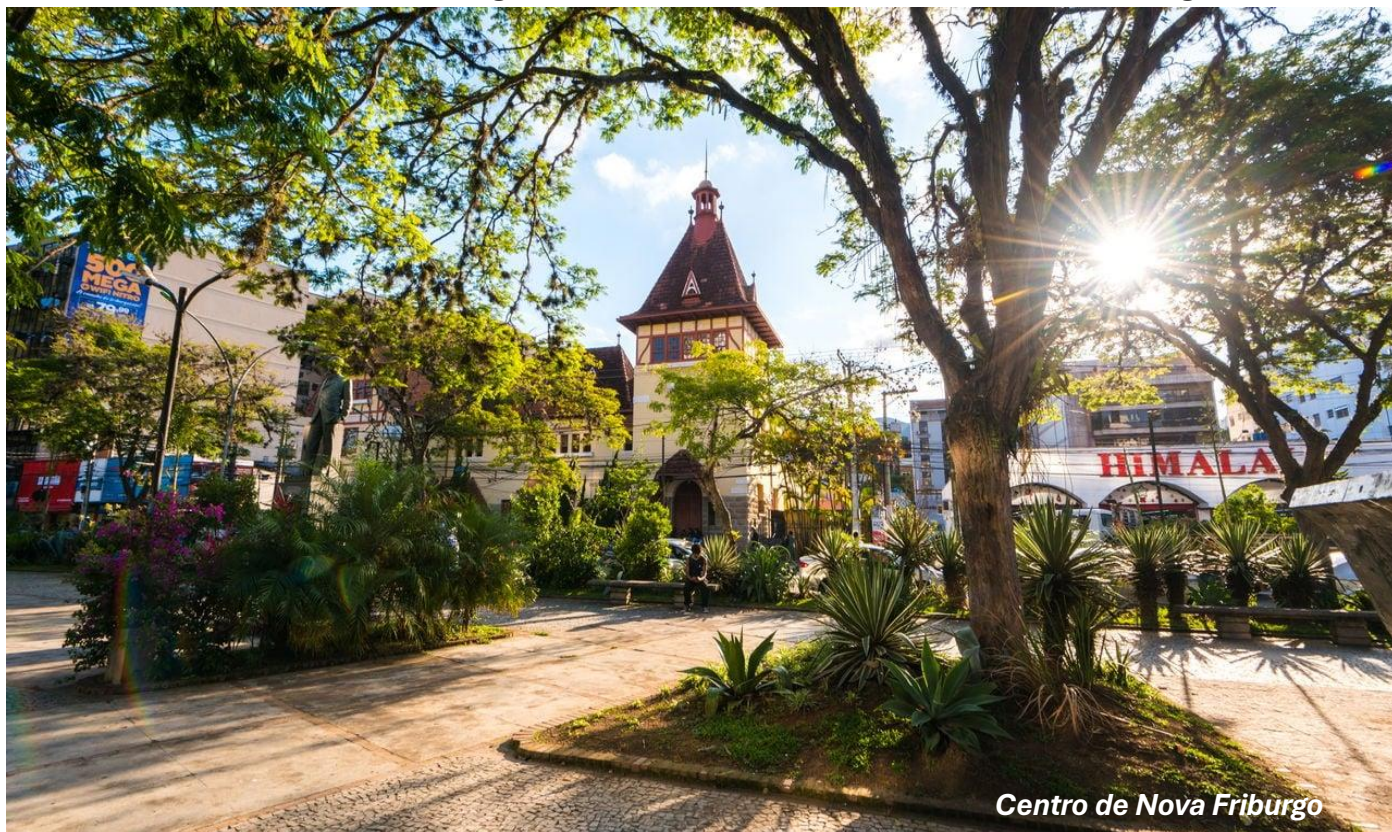
Centro de Nova Friburgo

Embarque no local determinado pela NATURE. Viagem em ônibus ou micro-ônibus de turismo com destino à cidade de Nova Friburgo, a 142 km do Rio. Na chegada, visitaremos uma Fazenda Familiar de Flores, uma das pioneiras no plantio de flores em Nova Friburgo, onde mergulharemos em um “mar de flores” das mais variadas espécies e belezas. Nova Friburgo é considerada a segunda maior produtora de flores de corte do Brasil. ALMOÇO incluso. Na parte da tarde, iremos ao Circuito Turístico de moda íntima Ponte da Saudade, ótimo local para compras de moda íntima. Parada na tradicional fábrica de Outlet da Triumph. Prosseguindo, visitaremos a famosa Padaria Superpão, considerada uma padaria-modelo no país que recebe visitas semanais de panificadores da região e de outros estados. Produz diariamente 950 produtos artesanais, num espaço de mil m 2 que funciona 24h. HOSPEDAGEM no Hotel Dominguez Plaza ou similar no centro de Nova Friburgo.