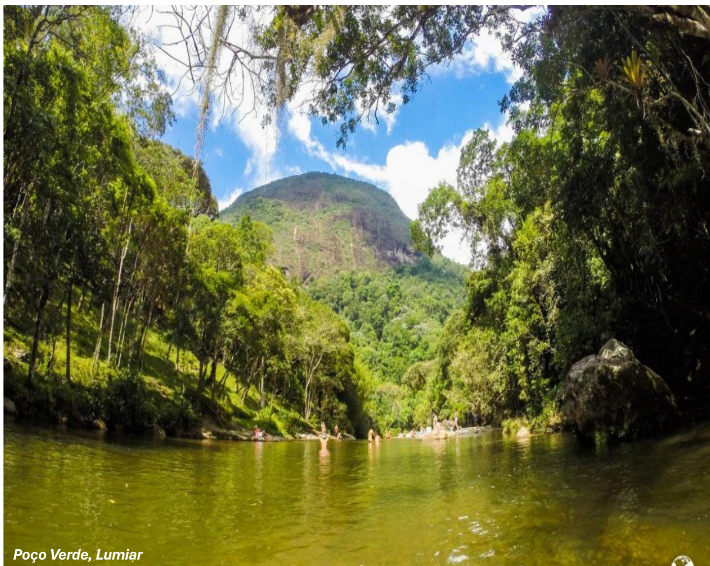
Poço Verde, Lumiar

07h20min: Rua Conde de Bonfim, 67- Tijuca – Rio de Janeiro - RJ