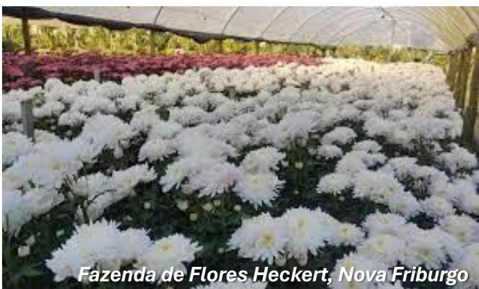
Fazenda de Flores Heckert, Nova Friburgo